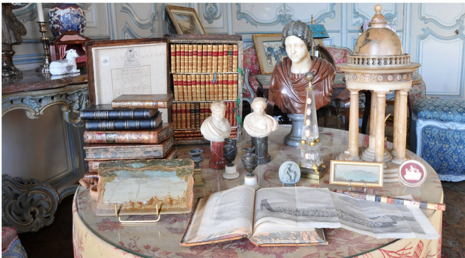
La Table du grand tour

Dans le bureau, cabinet exotique, sur la table des objets d'Orient, vous découvrirez un grand plat d'Iznik, un écrioire en laque du Japon et de nombreux objets de la compagnie des Indes. Entre le diner et le souper, on avait l'habitude de prendre une petite collation ou goûter. Au début du 18ème siècle la collation est salée et est remplacée à la fin du siècle par la prise du chocolat ou le service du thé. Dans le bureau, remarquez un service à thé aux dragons qui a été offert par l'Impératrice de Chine Cixi à la famille. Dans la chambre de Louise Aimée, le plateau du chocolat est posé sur une table « volante ». Dans la salle à manger, ustensiles et sucriers évoquent l'aventure du sucre. Le Grand Tour a été le fil