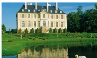
LE CHATEAU DE VENDEUVRE JOYAU DE LA NORMANDIE