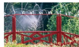
LES JETS D'EAU SURPRISES ET SON JARDIN REMARQUABLE