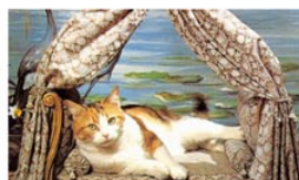
LE MUSÉE DU MOBILIER MINIATURE UNIQUE AU MONDE